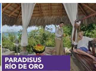
PARADISUS RÍO DE ORO