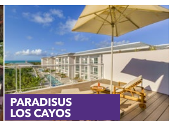
PARADISUS LOS CAYOS