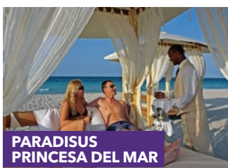
PARADISUS PRINCESA DEL MAR

*Les avantages de Resort Credit s'appliquent aux séjours compris entre le 1er mai 2019 et le 21 décembre 2019 dans les hôtels Paradisus de Cuba. Veuillez consulter meliacuba.com pour toutes les conditions